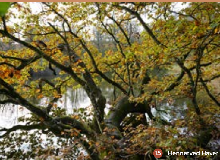
15 Hennemmed Haver