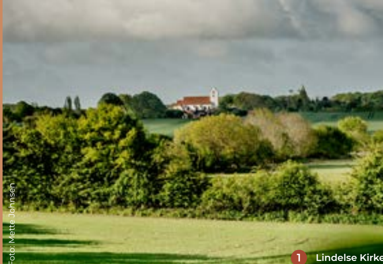
1 Lindelse Kirke