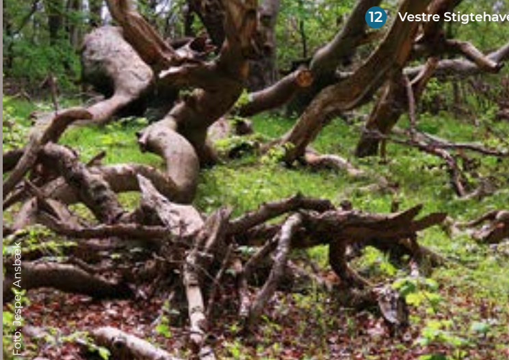
12 Vestre Stigehave